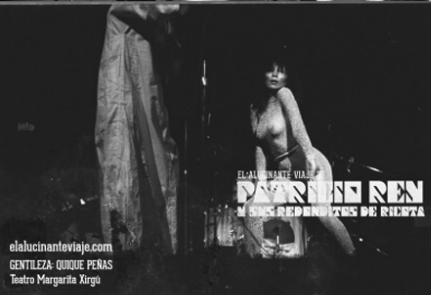
elalucinanteviaje.com GENTILEZA: QUIQUE PEÑAS Teatro Margarita Xirgu