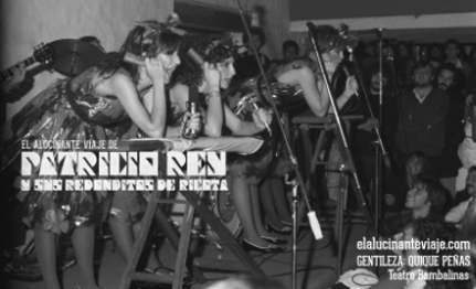
elalucinanteviaje.com GENTILEZA: QUIQUE PEÑAS Teatro Bambalinas