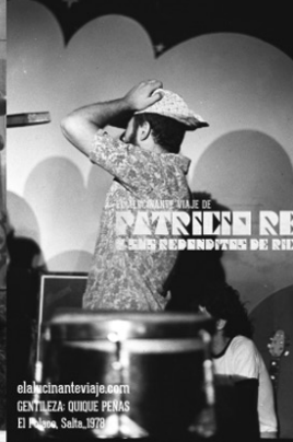
elalucinanteviaje.com GENTILEZA: QUIQUE PEÑAS El Puma, Salta, 1978