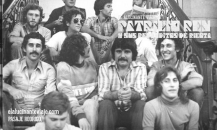
elalucinanteviaje.com PASAJE RODRIGO