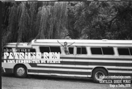
elalucinanteviaje.com GENTILEZA: QUIQUE PEÑAS Viaje a Salta, 1978